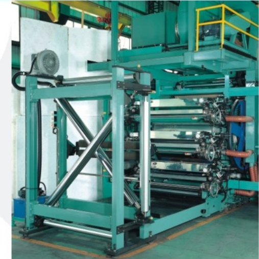
With 3+3 full web width turn bar 配備 3+3 全幅寬反轉架